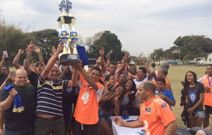
São Sebastião Futebol Clube - Campeão Bairrão 2017