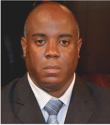
Buiú do Ônibus