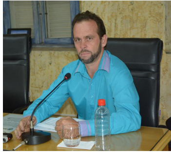
Carlúcio Mecânico - SD Indicações:

* Solicitando ao Prefeito Municipal e ao Secretário Municipal de Administração, as seguintes informações: Como está a situação da Licença de Incentivo à Disciplina, Assiduidade e Pontualidade – LIDAP? Quando será corrigido o erro técnico, que alterou o inciso VII do artigo 125 da Lei 2.673, de 1995, que foi acrescentado pela Lei 4.818, de 2008? Foi publicado no Blog do Madeira, em 23 de junho deste ano, que a Secretaria Municipal de Administração estaria fazendo a revisão das leis sobre os servidores. Quando esta revisão será concluída? Quando o Projeto de Lei que restitui a LIDAP será enviado à Câmara Municipal de Varginha pelo Poder Executivo? Como fica a situação dos servidores públicos que foram privados da LIDAP neste período em que foi suspensa? Como está o andamento e que providências estão sendo tomadas a respeito?