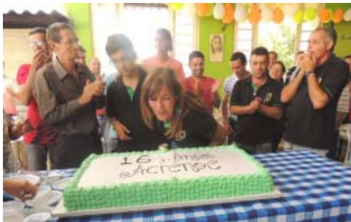
Racib da Acrenec soprando a vela dos 16º Aniversário da ACRENOC