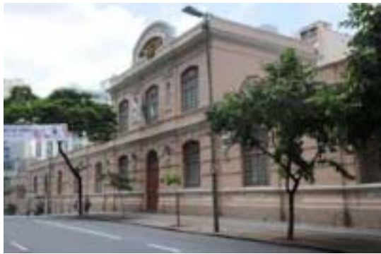
Prédio da Imprensa Oficial na Av. Augusto de Lima - BH

Ficou definido também que os bens materiais ficarão com a Seplag, enquanto os bens imóveis serão revertidos ao patrimônio do Estado. Quanto aos servidores, também passarão a trabalhar na Secretaria e poderão ser cedidos a outros órgãos da administração direta ou indireta, sem prejuízo de salário.