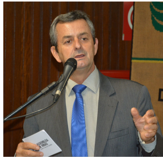
Deputado Antonio Carlos Arantes

“A cafeicultura foi e continua sendo o grande pilar da nossa economia e nosso papel, como poder público, é abrir os canais de discussão. A Audiência Pública é um importante instrumento onde todos os envolvidos podem levar suas ideias e reivindicações. Escolhemos o município de Machado por ser uma das cidades referência na área cafeeira em todo o Estado”, disse o deputado Emidinho Madeira.