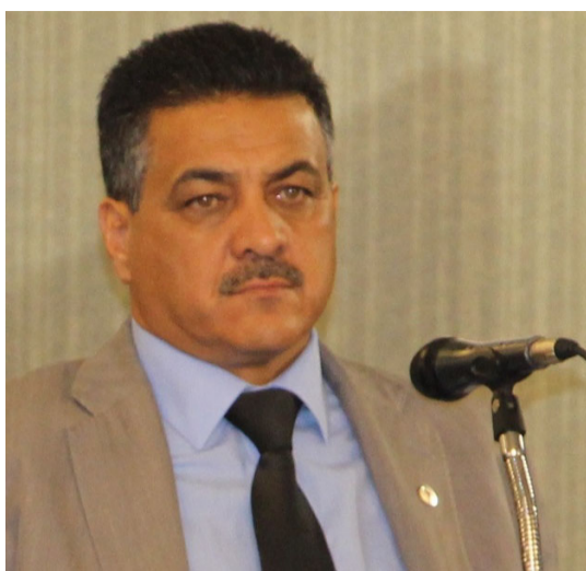
Deputado Emidinho Madeira

A audiência pública ainda não tem data para acontecer